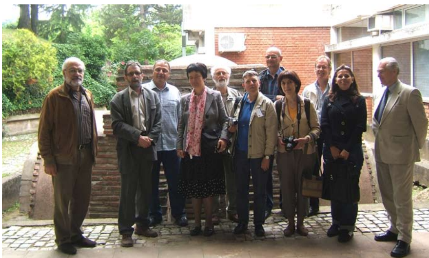
Сл. 4 На излету, учесници симпозијума у обиласку ранохришћанске гробнице у Нишкој Бањи