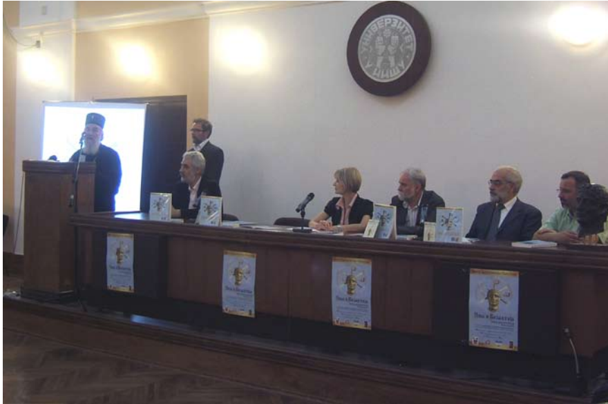
Сл. 1 Његова Светост Патријарх српски Господин Иринеј, свечано отварање симпозијума „Ниш и Византија IX“ Fig. 1 His Holiness Serbian Patriarch Mr. Irinej, opening ceremony „Nis and Byzantium IX“

који је покренут са идејом да се научни скуп одржава на дан св. цара Константина и царице Јелене (3-5 јун), са циљем да се до 2013. године, на годишњицу доношења Миланског едикта профилише као један од еминентних европских научних скупова на тему Византијске цивилизације, културе и уметности. Ове, 2010. године, можемо без двоумљења закључити, да је симпозијум „Ниш и Византија“ прерастао у један од најеминентнијих традиционалних скупова византолога који се у овом тренутку одржавају у свету. Научници из свих крајева света усмеравали су своја знања на Ниш и Византију, чиме су умногоме измењена и допуњена наша сазнања о Славном граду Нишу. После девет година одржавања симпозијума, захваљујући научним